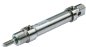
Siłowniki ze stali nierdzewnej ISO 6432, Ø 16 ÷ 25 mm

ISO 6432 stainless steel cylinders, diameters from 16 to 25 mm