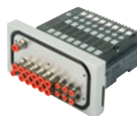
Wyspa zaworowa serii HDM dla obszarów mycia wysokociśnieniowego - od 4 do 16 elektrozaworów na wyspie.

Round stainless steel cylinders, diameters from 32 to 63 mm