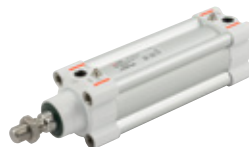
Siłowniki ISO 15552 serii HCR o podwyższonej odporności na korozję, Ø 32 ÷ 125 mm

ISO 6432 stainless steel cylinders, diameters from 16 to 25 mm